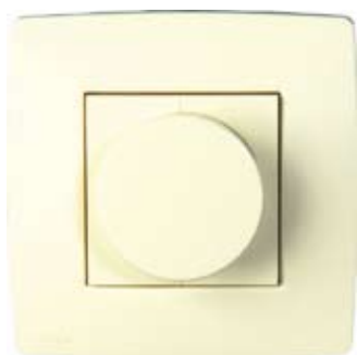
Sterownik RS 3

Przełącznik RF może być połączony z konwencjonalnym przełącznikiem trójstopniowym typu RS 3. Tryb pracy wentylatora określany jest przez ostatnio użyty sterownik.